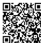
POO マスター 養成研修会